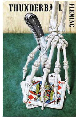
ภาพที่ 2: รูปปกฉบับพิมพ์แรกของนวนิยายเจมส์ บอนด์ เรื่อง Casino Royale, Dr.No และ Thunderball ของเอียน เฟลมมิง