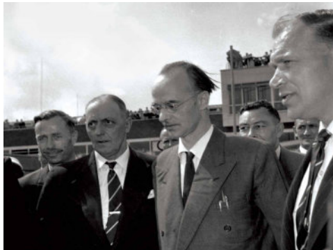
ภาพที่ 1: เคลาส์ ฟุคส์ ภายใต้การคุ้มกันของเจ้าหน้าที่หน่วยความมั่นคงของอังกฤษ (MI5) ณ สนามบินฮีทโธรว์ (Heathrow Airport) กรุงลอนดอน ใน ค.ศ. 1949

สำรวจเป้าหมายที่รัฐบาล หรือหน่วยข่าวกรองต้องการล้วงความลับ แล้วจึงทำการสอดแนมและจารกรรมข้อมูลออกมาเป็นข้อความ ภาพฟิล์ม หรือรูปวาดที่สามารถนำข้อมูลไปใช้ให้เกิดประโยชน์ต่อการตั้งรับและตอบโต้ทางยุทธศาสตร์ต่อไปได้ ดังกรณี “เคลาส์ ฟุคส์” (Klaus Fuchs) และ “เทต ฮอลล์” (Ted Hall) สองนักวิทยาศาสตร์ที่เป็นส่วนหนึ่งในการทดลองระเบิดปรมาณูลูกแรกของสหรัฐฯ ทำการส่งข้อมูลต้นแบบระเบิดปรมาณูอย่างละเอียดให้กับทางเจ้าหน้าที่โซเวียต จนโซเวียตสามารถทดลองระเบิดปรมาณูลูกแรกได้สำเร็จใน ค.ศ. 1949 เปิดทางให้โซเวียตพัฒนาอาวุธที่มีประสิทธิภาพทำลายล้างสูงเท่าทันสหรัฐฯ การแข่งขันพัฒนาและสะสมอาวุธนิวเคลียร์ของ 2 ชาติมหาอำนาจจึงเริ่มเข้มข้นและตึงเครียดมากขึ้นในช่วงทศวรรษ 1950 เป็นต้นมา 8 การครอบครองความเหนือกว่าทางเทคโนโลยีด้านอาวุธจึงเป็นยุทธศาสตร์สำคัญต่อสงครามเย็น ด้วยเหตุนี้ การแข่งขันในสงครามเย็นจึงครอบคลุมไปถึงการจารกรรมข้อมูลซึ่งมีวัตถุประสงค์เพื่อรักษาความสมดุลทางศักยภาพด้านอาวุธระหว่างกันไม่ให้เสียเปรียบฝ่ายตรงข้ามได้