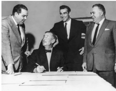
ภาพที่ 4: อัลเบิร์ต อาร์. บร็อคโคลี, เอียน เฟลมมิง, ฌอน คอนเนอร์ และ แฮร์รี ซอลท์ซแมน (เรียงจากซ้ายไปขวา) ในการถ่ายภาพโปรโมตภาพยนตร์ ก่อนเริ่มการถ่ายทำภาพยนตร์ “พยัคฆ์ร้าย 007” (Dr.No) ใน ค.ศ. 1962

ซึ่งมีส่วนช่วยเสริมสร้างภาพลักษณ์ของรัฐบาลและหน่วยสืบราชการลับอังกฤษให้ปรากฏในฐานองค์กรที่มีความทันสมัยและมีประสิทธิภาพในเวทีโลก ด้วยเหตุนี้ จึงส่งผลให้ผลลัพธ์เชิงอุดมการณ์ของภาพยนตร์อาจถูกมองว่าเป็น “ผลลัพธ์ทางอุดมการณ์ที่เกิดขึ้นโดยไม่ได้ตั้งใจ” (Unintended Ideological Outcome) 38 กล่าวคือ แม้แรงจูงใจของแต่ละฝ่ายจะแตกต่างกัน แต่เนื้อเรื่อง ตัวละคร และการจัดวางวายร้ายในภาพยนตร์กลับบรรจบกันในการทำให้ระเบียบโลกเสรีนิยมตะวันตกดูมีความชอบธรรมและน่าเชื่อถือในสายตาผู้ชมมากขึ้น