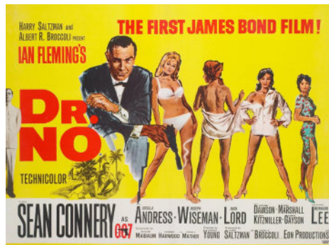
ภาพที่ 3: โปสเตอร์ภาพยนตร์พิกซ์ร้าย 007 (Dr.No) ในโรงภาพยนตร์ของอังกฤษ ใน ค.ศ. 1962

จากกระแสความนิยมภาพยนตร์แนวจารกรรม ทำให้ภาพยนตร์เรื่อง “Dr.No” ได้รับความนิยมอย่างสูงทั้งในอังกฤษและสหรัฐฯ แม้กระทั่ง จอห์น เอฟ. เคนเนดี (John F. Kennedy) ประธานาธิบดีสหรัฐฯ ก็เป็นแฟนตัวยงของเจมส์ บอนด์ด้วยเช่นกัน อย่างไรก็ตาม สหภาพโซเวียตกลับมองว่าเจมส์ บอนด์ คือเครื่องมือโฆษณาชวนเชื่อของระบบทุนนิยมที่พยายามทำให้โลกตะวันตกเกลียดชังคอมมิวนิสต์ เพราะในสายตาของโลกคอมมิวนิสต์ เจมส์ บอนด์ คือ “สัตว์ร้ายจากโลกทุนนิยม” (Capitalist Beast) ที่หวังจะทำลายระบอบคอมมิวนิสต์ เพียงเพื่อปกป้องผลประโยชน์ของชนชั้นนายทุนเท่านั้น ถึงขั้นทำให้โซเวียตมีแนวคิดในการสร้างภาพลักษณ์ “สายลับโซเวียตในอุดมคติ” ที่ตรงข้ามกับเจมส์ บอนด์ขึ้นมาเพื่อเป็นตัวแทนจากโลกคอมมิวนิสต์เช่นกัน 31 ทำให้ความขัดแย้งทางอุดมการณ์ยิ่งตอกย้ำบทบาทของภาพยนตร์ในฐานะเครื่องมือโฆษณาชวนเชื่อมากขึ้น และยังทำให้ภาพยนตร์แนวสายลับจารชนได้รับความนิยมมากในช่วงทศวรรษ 1960 โดยเฉพาะภาพยนตร์เรื่อง Dr.No สามารถทำรายได้จากผู้ชมทั่วโลกสูงถึง 60 ล้านปอนด์ 32 ทำให้บริษัทอ็อน โปรดักชันส์กลายเป็นผู้ผลิตภาพยนตร์สายลับระดับโลก ความร่วมมือระหว่างบริดจ์โคลีกับซอลท์ซแมนส่งผลให้เกิดการพัฒนาภาพยนตร์เจมส์ บอนด์อย่าง