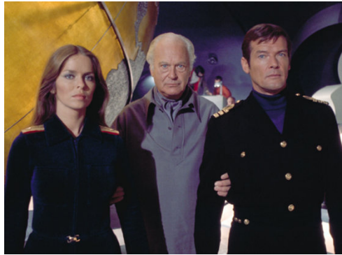
ภาพที่ 6: อันยา อมาโซวา, คาร์ล สตรอมเบิร์ก และเจมส์ บอนด์ “โรเจอร์ มัวร์” (เรียงจากซ้ายไปขวา) ในภาพยนตร์เรื่อง “พยัคฆ์ร้ายสุดที่รัก” (The Spy Who Loved Me) ค.ศ. 1977

การแทรกแซงอัฟกานิสถานของสหภาพโซเวียตใน ค.ศ. 1979 เพื่อช่วยเหลือรัฐบาลคอมมิวนิสต์ในการปราบปรามขบวนการต่อต้าน นับเป็นจุดสิ้นสุดของยุคผ่อนคลายความตึงเครียดในสงครามโลก และทำให้โลกกลับเข้าสู่ช่วง“สงครามเย็นครั้งใหม่” (New Cold War) ในต้นทศวรรษ 1980 โดยภายใต้รัฐบาลของ “โรนัลด์ เรแกน” (Ronald Reagan) และ “มาร์กาเรต แทตเชอร์” (Margaret Thatcher) สหรัฐฯ และอังกฤษมีจุดยืนร่วมกันในการต่อต้านลัทธิคอมมิวนิสต์ โดยวิพากษ์วิจารณ์แนวทางประนีประนอมกับโซเวียตในช่วงผ่อนคลายความตึงเครียดว่า “เป็นการลดทอนศักดิ์ศรีของโลกเสรี” ทั้งยังเป็นการเปิดโอกาสให้โซเวียตใช้บรรยากาศของการผ่อนคลายทางการเมืองช่วงสงครามเย็นพัฒนาเทคโนโลยีอาวุธอย่างต่อเนื่อง จนสามารถมี “ขีปนาวุธข้ามทวีป” (Intercontinental Ballistic Missile : ICBM) ในครอบครองเป็นจำนวนมาก 50 การพัฒนาเทคโนโลยีด้านอาวุธของโซเวียตจึงกลายเป็นภัยคุกคามต่อสหรัฐฯ แล้ว รัฐบาลเรแกนซึ่งมีมุมมองว่าโซเวียตเป็น “จักรวรรดิอันชั่วร้าย” (Evil Empire) ที่ไม่อาจไว้วางใจได้อีก จึงตัดสินใจเพิ่มงบประมาณด้านความมั่นคงเพื่อพัฒนาเทคโนโลยีด้านอาวุธและระบบป้องกันภัยทางอากาศภายในประเทศ เพื่อช่วงชิงความได้เปรียบทางยุทธศาสตร์กลับคืนมาจาก โซเวียตอีกครั้ง 51 ส่วนรัฐบาลแทตเชอร์ก็สนับสนุนนโยบายการสกัดกั้นสหภาพโซเวียตของสหรัฐฯ