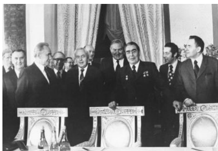
ภาพที่ 5: ฮาโรลด์ วิลสัน (สมัยที่ 2) เดินทางพบปะกับลีโอนิด เบรจเนฟ (Leonid Brezhnev) ในการลงนามข้อตกลงทวิภาคี ณ กรุงมอสโก ค.ศ. 1975

บรรยากาศของการแข่งขันในสงครามเย็นระหว่างสหรัฐฯ กับโซเวียตที่ตึงเครียดมาตลอดทศวรรษ 1950 เริ่มคลี่คลายลงในต้นทศวรรษ 1960 หลังวิกฤตการณ์ขีปนาวุธที่คิวบา ผ่านพ้นไป จนกระทั่งปลายทศวรรษ 1960 โลกเข้าสู่ “ยุคผ่อนคลายความตึงเครียด” (Détente) ที่สองชาติอภิมหาอำนาจเห็นถึงความจำเป็นในการลดความตึงเครียดในการแข่งขันด้านการผลิตและสะสมอาวุธนิวเคลียร์เพื่อเป็นการรักษาสันติภาพของโลกไว้ รัฐบาลวิลสันมีบทบาทสนับสนุนการเจรจาระหว่างสหรัฐฯ กับโซเวียต โดยเฉพาะในประเด็นการควบคุมอาวุธนิวเคลียร์ และการเจรจาในข้อตกลงทวิภาคี เช่น “สนธิสัญญาห้ามแพร่กระจายอาวุธนิวเคลียร์” (Nuclear Non-Proliferation Agreement: NPT) ใน ค.ศ. 1969 “การเจรจาลดอาวุธทางยุทธศาสตร์” (Strategic Arms Limitation Talk: SALT) ใน ค.ศ. 1972-1979 “ข้อตกลงเฮลซิงกิ” (Helsinki Accord) ใน ค.ศ. 1975 47 เนื่องจากทั้งสองประเทศเล็งเห็นถึงความสำคัญในการลดความเสี่ยงจากสงครามอาวุธนิวเคลียร์ จึงหันมาเจรจาทันทีมากขึ้น มีการแลกเปลี่ยนทางวัฒนธรรมและวิทยาศาสตร์ รวมถึงลงนามข้อตกลงทางการค้าที่เพิ่มขึ้น ซึ่งช่วยให้ความสัมพันธ์ระหว่างอังกฤษกับโซเวียตในช่วงผ่อนคลายความตึงเครียดกลับมาดีขึ้น