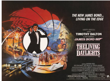
ภาพที่ 7: โปสเตอร์ภาพยนตร์เรื่อง “พยัคฆ์สะบัดลาย” (The Living Daylights) นำแสดงโดย “ทีโมธี ดอลตัน” (Timothy Dalton) ใน ค.ศ. 1987

อย่างไรก็ตาม สถานการณ์ความตึงเครียดในสงครามเย็นเปลี่ยนไปเมื่อ “มิกฮาอิล กอร์บาชอฟ” (Mikhail Gorbachev) ขึ้นเป็นผู้นำแห่งสหภาพโซเวียต ใน ค.ศ. 1985 เขาเลือกปรับนโยบายการต่างประเทศเพื่อฟื้นฟูบรรยากาศของการผ่อนคลายความตึงเครียดกับสหรัฐฯ อีกครั้ง 58 กอร์บาชอฟเลือกปฏิรูปเศรษฐกิจเพื่อแก้ไขปัญหาความขาดแคลนสินค้าอุปโภคบริโภค ควบคู่กับการเปิดโอกาสให้มีการเจรจาระหว่างผู้นำโลกตะวันตกมากขึ้น นอกจากนี้ เขายังผลักดันให้ประเทศคอมมิวนิสต์ในยุโรปตะวันออกดำเนินนโยบายเพื่อลดความตึงเครียดทางสังคมด้วย จนนำไปสู่การปฏิวัติในยุโรปตะวันออก ใน ค.ศ. 1989 ที่ทำให้ระบอบคอมมิวนิสต์ในยุโรปตะวันออกสิ้นสุดลง 59